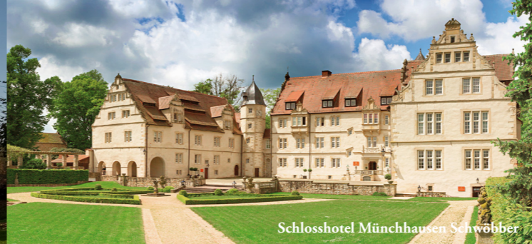
Schlosshotel Münchhausen Schwöbber