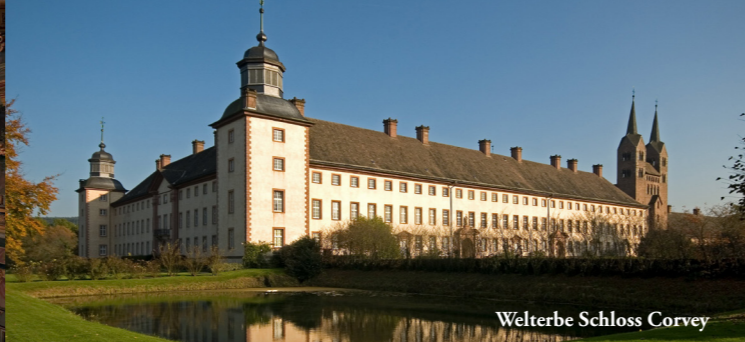
Welterbe Schloss Corvey